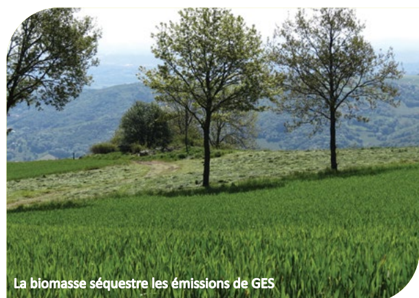
La biomasse séquestre les émissions de GES