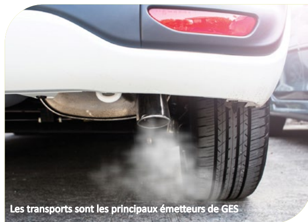
Les transports sont les principaux émetteurs de GES